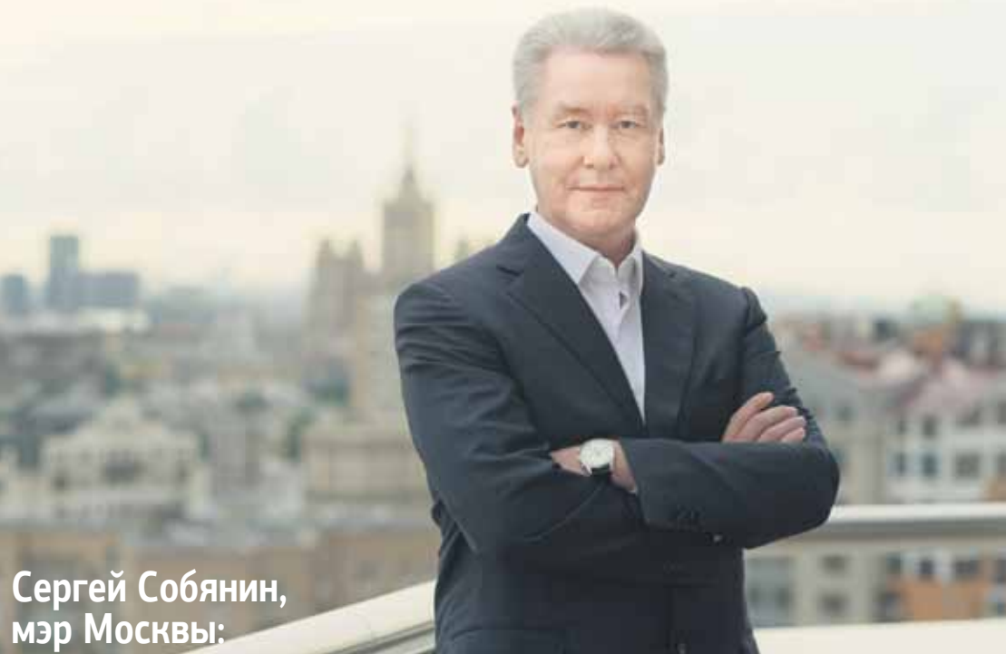
Сергей Собянин, мэр Москвы:

ЦВЕТНОЙ бульвар, Рождественский бульвар, Екатерининский парк, территория НИИ им. Н. В., Ботанический сад МГУ.